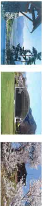
①ひんのびき博物館