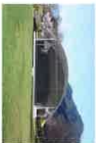
②ひんのびきの里公園