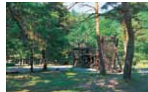
白馬グリーンスポーツの森 (C-6)

日本の道百選のひとつ。ここから望む白馬連峰と清流の調和が素晴らしい。近くに露天風呂やキャンプサイトもあります。