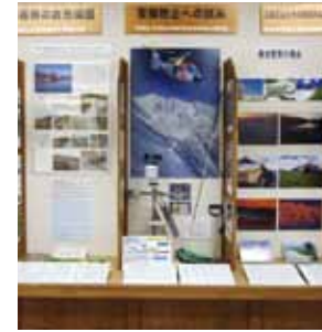
白馬・山とスキーの総合資料館 (A-3)

誰でも楽しめるアウトドアレクリエーション広場。敷地内には白馬村歴史民俗資料館もあり、白馬村の貴重な生活史を展示。園内での自転車走行は禁止されています。